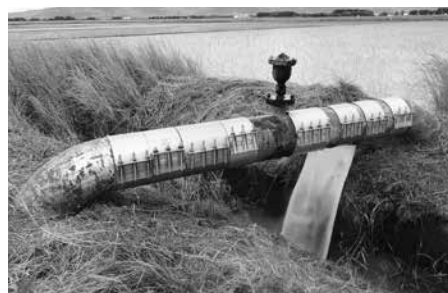
中主地区水管橋更新(その2)工事 該当箇所