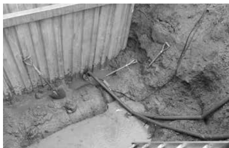
新庄服部幹線送水路修理工事 該当箇所(R5漏水時)