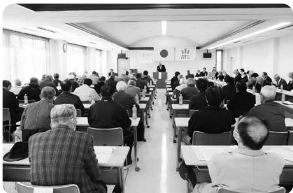
事務所2階 会議室にて